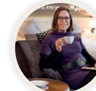
ANDREA MATHIS DÉBITEURS / CRÉDITEURS